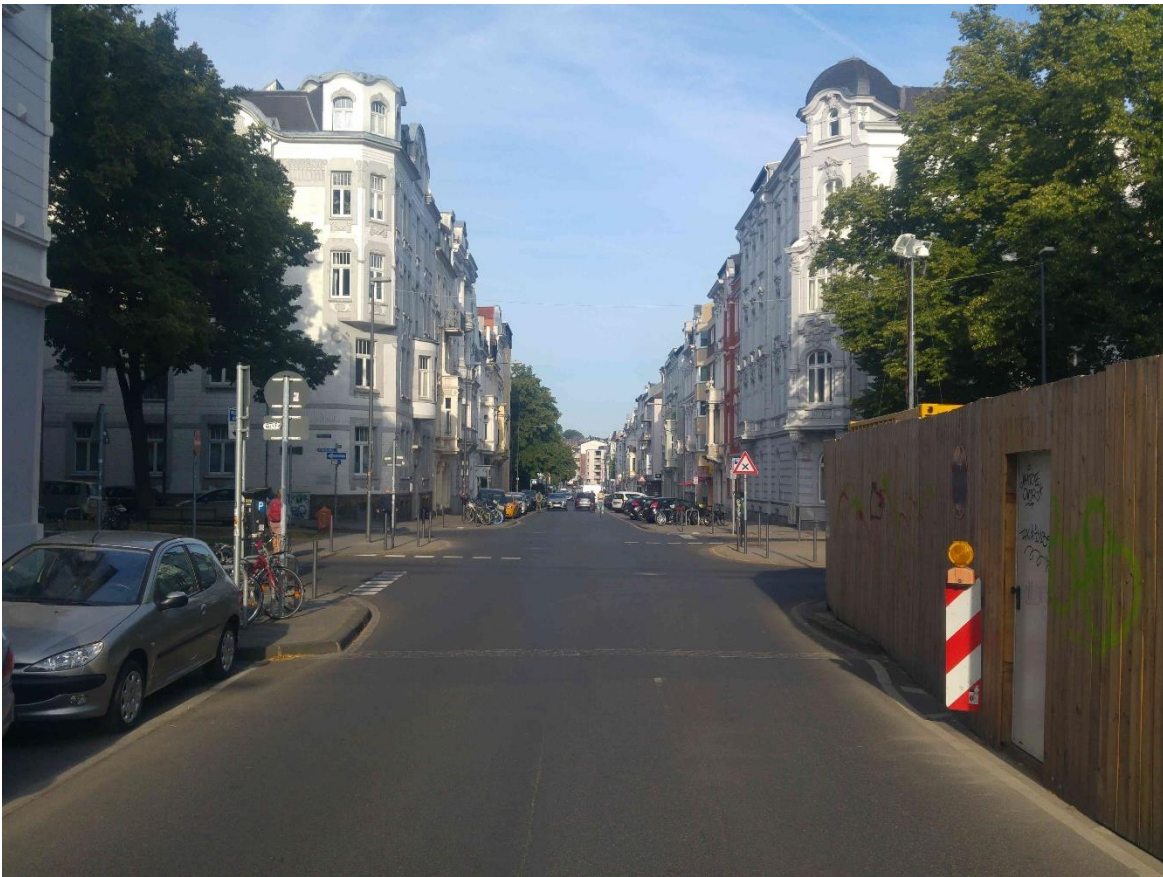
Abbildung 2: Kreuzung Bismarckstraße / Viktoriaallee – Istzustand